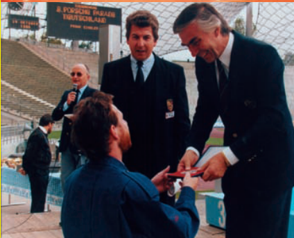
Für alle Teilnehmer ein Erinnerungsgeschenk